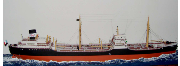
Pétrolier ESSO BRETAGNE- Type T2

La technique maritime a du satisfaire à la curiosité d'aller au-delà des mers. L'enseignement de la navigation s'est imposé et a du, au cours des siècles, tant conduire la transformation des instruments de navigation que suivre la conception des navires, et le conditionnement du fret.