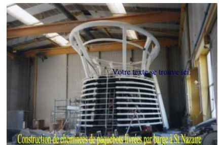
Construction de cheminées de paquebots livrées par barge à St Nazaire

Les refontes de l'enseignement maritime ont été nombreuses .Elles s'accroissent au rythme rapide de l'évolution des techniques et des pratiques commerciales mondiales.C'est dire que les acquis de la formation initiale, sont assez vite obsolètes.